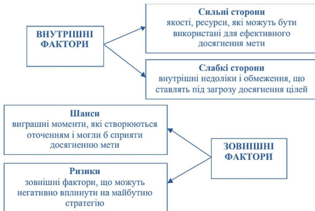
Мал. 1 Елементи SWOT-аналізу

Методологія SWOT-аналізу була розроблена в середині минулого століття для знаходження та прийняття обґрунтованих рішень на підприємствах, що стали діяти в умовах динамічного конкурентного середовища. Вона дала можливість поєднати важливі внутрішні якісні характеристики організації (сильні і слабкі сторони) з результатами досліджень зовнішніх умов (шанси та ризики) (див. рис.1). Аналіз сильних і слабких сторін об'єкта планування більш глибоко висвітлює те, які якості потрібно нарощувати і розширювати, а які тенденції в процесі розвитку потребують корегування. Дослідження зовнішніх факторів призначене виявити шанси та ризики, які можуть вплинути на майбутнє організації і водночас спрогнозувати можливу реакцію підприємства на ці виклики. З 80-х років минулого століття цей класичний інструмент стратегічного планування розвитку підприємств знаходить дедалі ширше застосування у публічному секторі, найперше як засіб критичного осмислення та оцінки регіональних та місцевих пріоритетів розвитку.