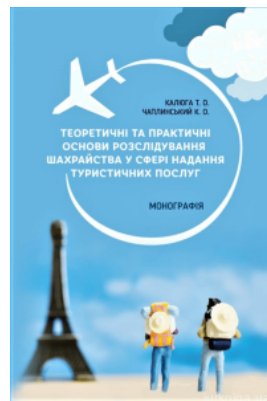
Теоретичні та практичні основи розслідування шахрайства у сфері надання туристичних послуг