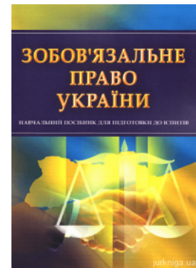
Зобов'язальне право України. Навчальний посібник для підготовки до іспитів