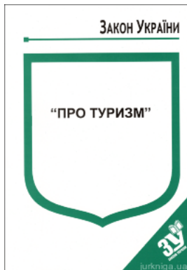
Закон України “Про туризм”