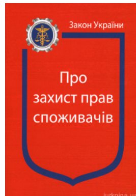
Закон України “Про захист прав споживачів”